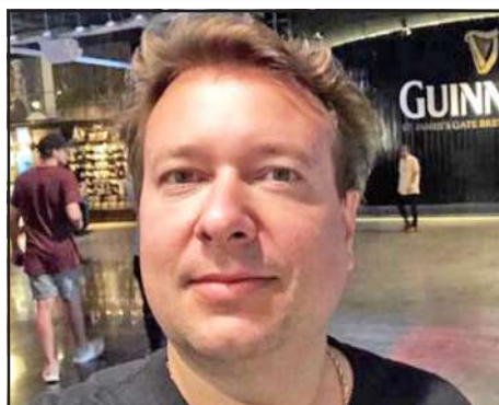
Rossano (Rep. Paraná) - 17 de Outubro