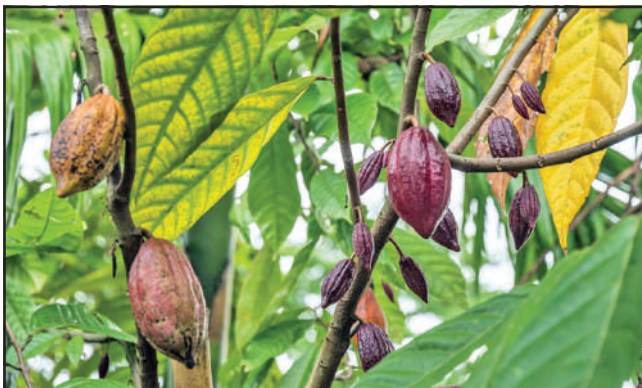
Muitas árvores apresentam frutos que são utilizados comercialmente.

Araribá: possui madeira com grande valor econômico, usada, por exemplo, na construção civil e naval, na carpintaria e na marcenaria.