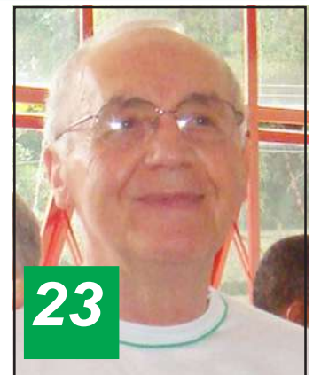
Martini (Rep. Paraná)