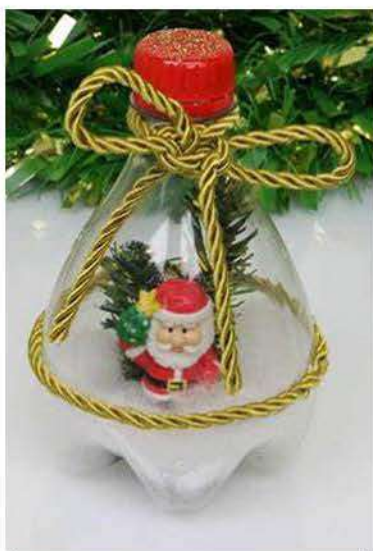
Feito com tampinha de garrafa