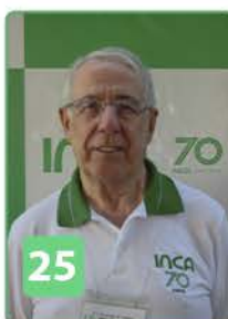
Clovis (Rep. São Paulo)