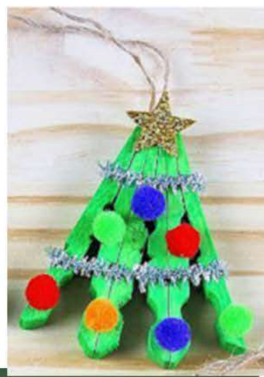
Presépio e anjinhos feitos com palitos de sorvete e árvore de Natal feita com prendedores de roupas