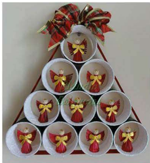
Feito com copinhos de plástico