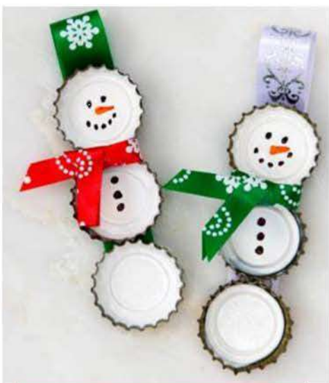
Feito com garrafa pet

Divirta-se, cuide do meio ambiente e Feliz Natal!