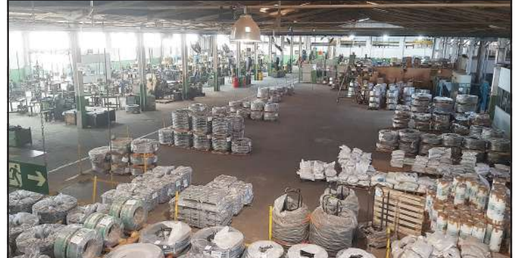
Vista da área produtiva em 2022