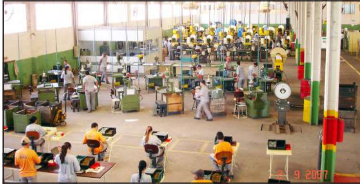
Vista da área produtiva em 2007