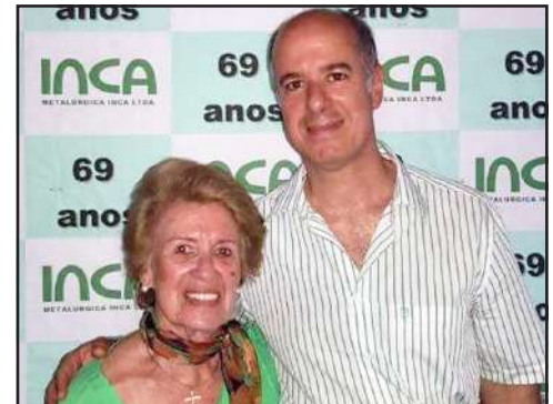
Diretores da empresa