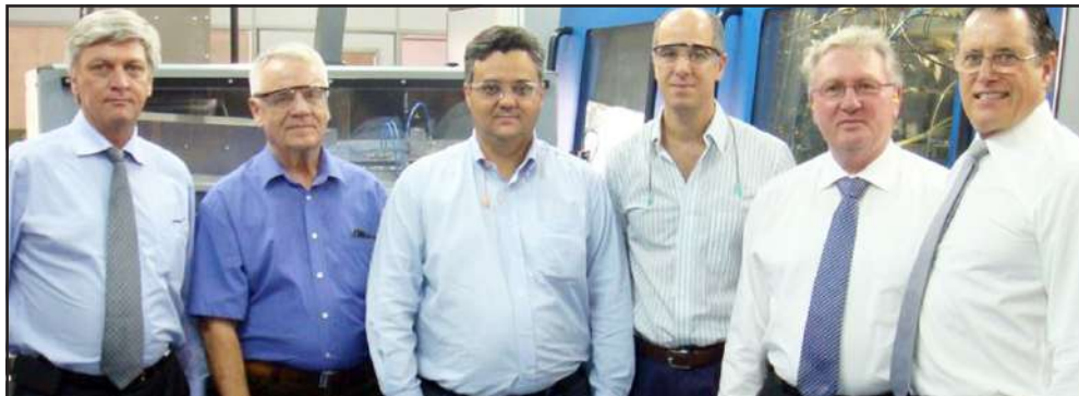
Visita internacional - Alemanha