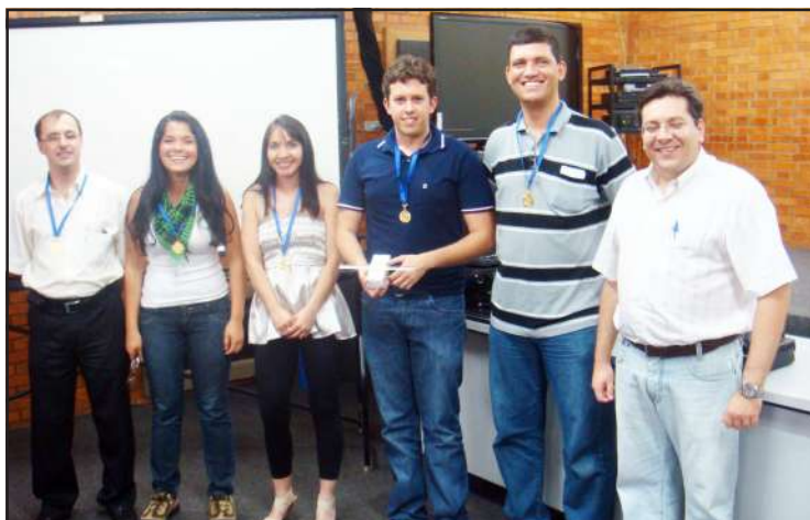
Trabalho em parceria com escola FATEC - Dia da qualidade