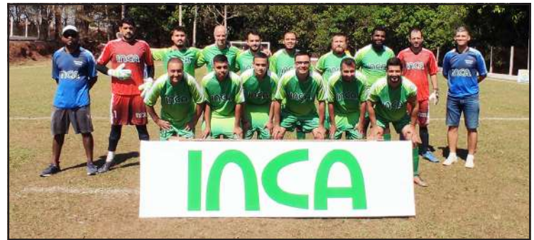
Futebol da Inca