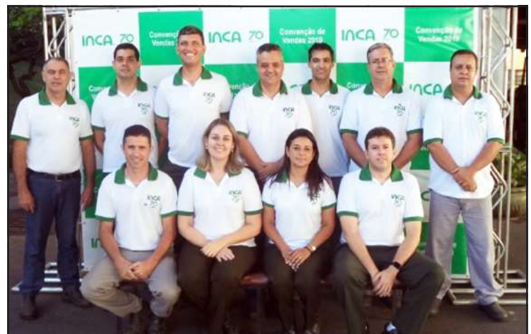
Time da fabrica